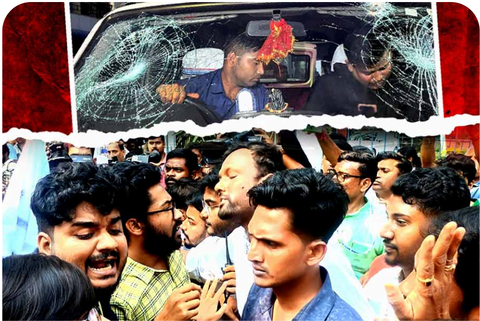
(উপরে) মন্ত্রী ব্রাত্য বসুর গাড়িতে ভাঙচুর। (নীচে) যাদবপুর বিশ্ববিদ্যালয়ে বামপন্থী পড়ষাদের বিক্ষোভ।

প্রথম পাতা কলকাতা পশ্চিমবঙ্গ ▾ দেশ বিদেশ সম্পাদকের পাতা ▾ আরও