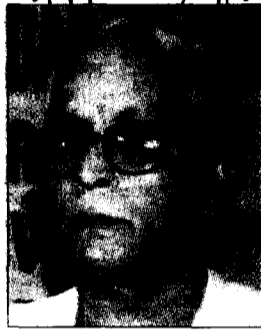
As their salaries increase, so does their demand for dowry

Referring to the recent human development report prepared by the state government, the chief minister talked about the