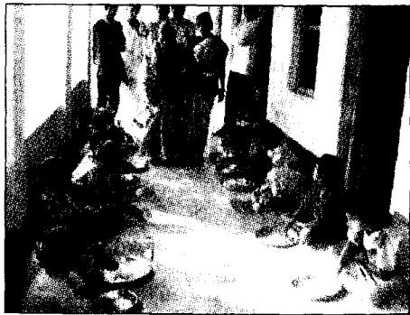
স্কুলবান্দায় সেই ১৪ জন।