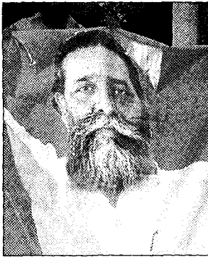
SOREN: CRY FLEE-DOM

Immediately after making obituary reference to a departed member, BJP members were on their legs, demanding Mr Soren's ouster.