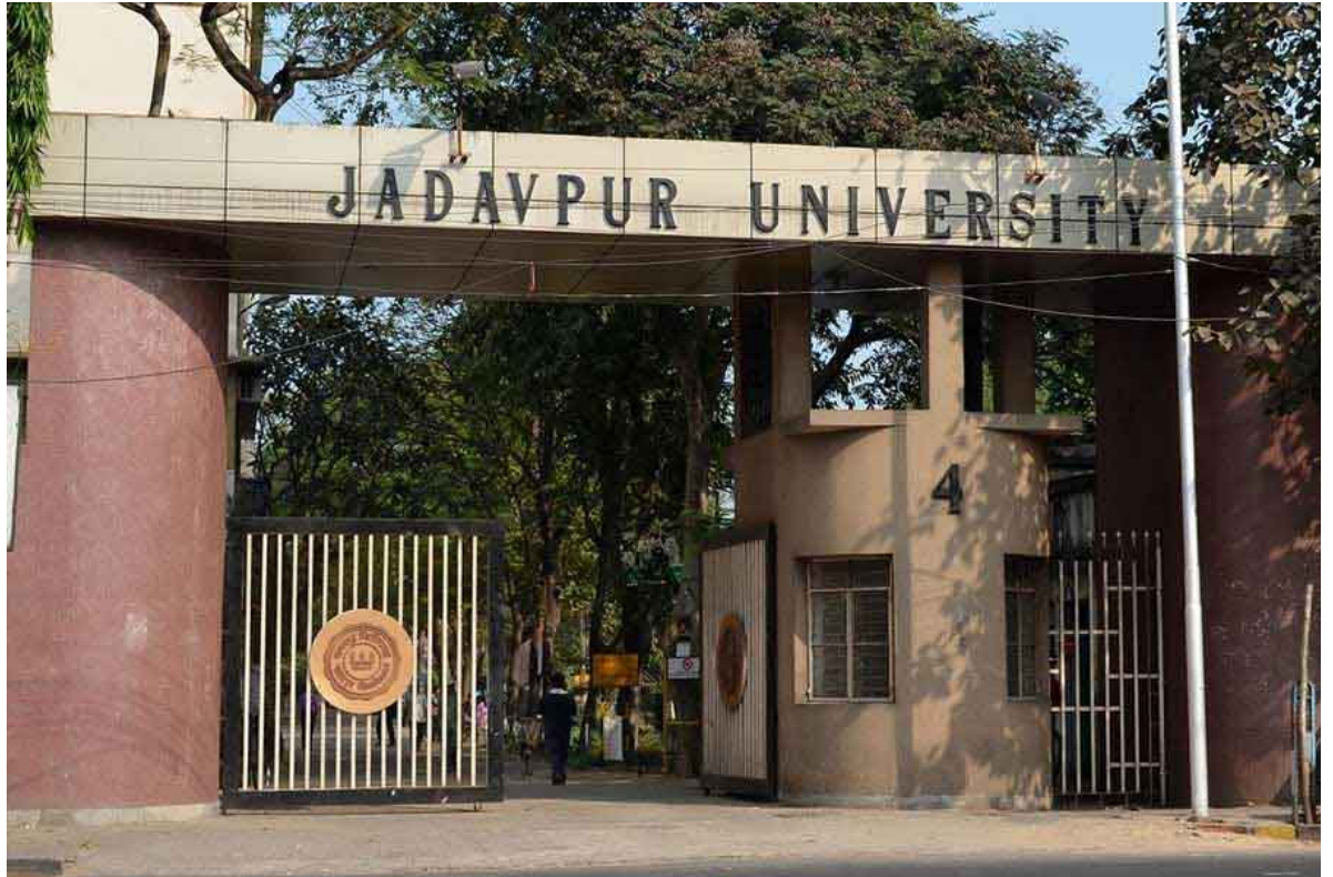
যাদবপুর বিশ্ববিদ্যালয়।