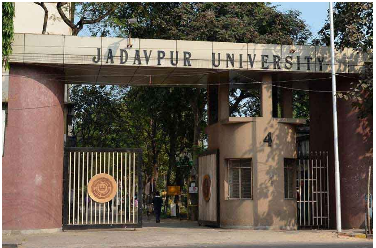
যাদবপুর বিশ্ববিদ্যালয়। —ফাইল চিত্র।

আগেই কর্তৃপক্ষ জানিয়েছিলেন, এ দিন কোনও রকম অনুষ্ঠান করার অনুমতি কাউকেই দেওয়া হয়নি। ক্যাম্পাসে কিছু পরীক্ষা রয়েছে।