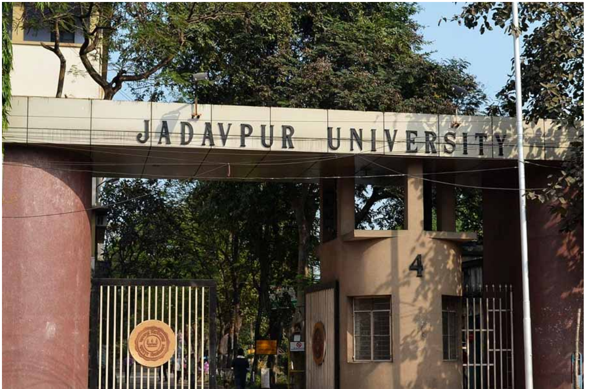
যাদবপুর বিশ্ববিদ্যালয়।